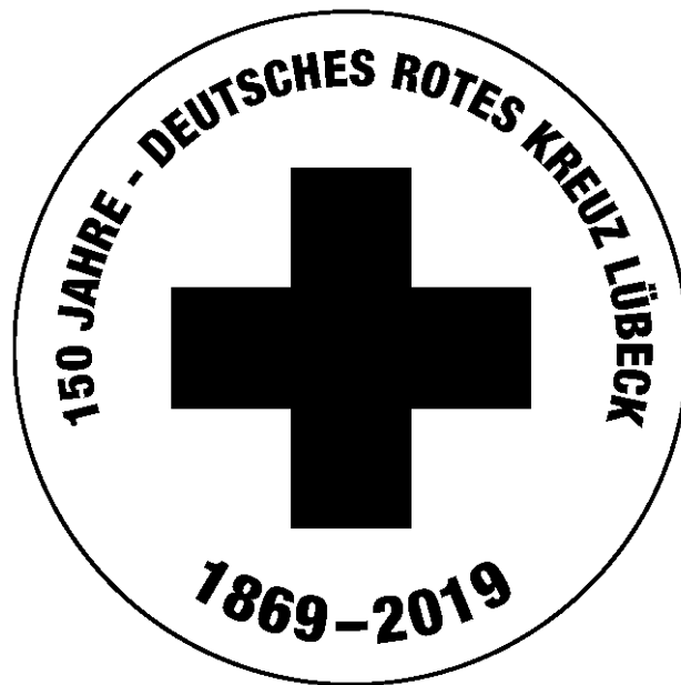
Abbildung 1: Prägung des Marzipantalers